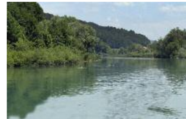
Naturnahe Ufer in Vorderdettigen.

In den vergangenen 100 Jahren wurden in der Schweiz tausende von Kilometern Fluss- und Bächläufen verbaut, begradigt, eingeengt oder in Röhren unter den Boden gelegt – zum Schutz vor Überschwemmungen, zur Gewinnung von Land oder um eine rationellere Bewirtschaftung zu ermöglichen. Damit wurden die