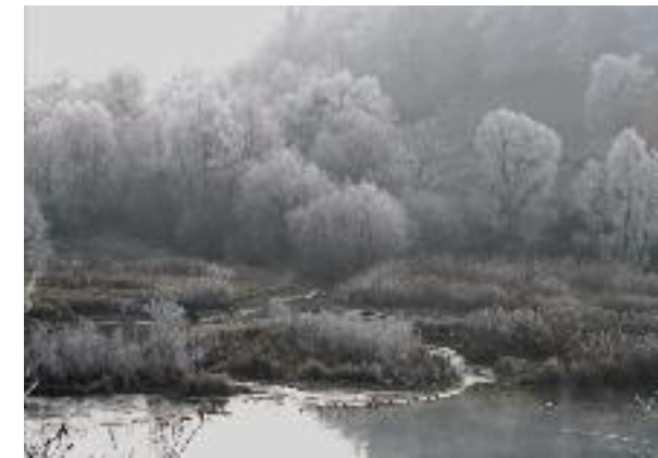
Wasserläufe im Gäbelbachdelta.

Der biologische Zustand des Wohlensees und seine Wasserqualität