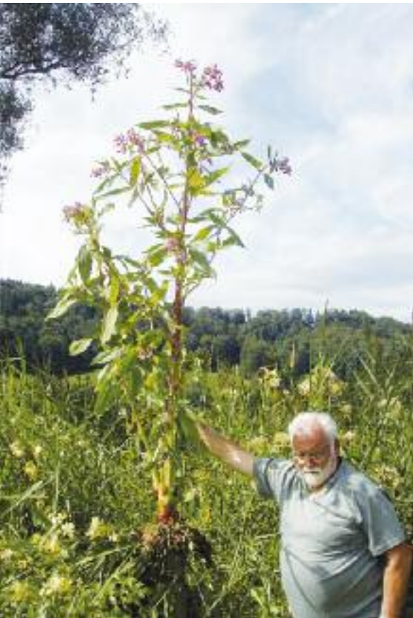
Eindrückliches Exemplar eines drüsigen Springkrauts.

siv ausgebreitet. Die Pensioniertengruppe des Schutzverbandes registriert alle Neophyten-Standorte am Wohlensee, die in einer Inventarliste nachgeführt werden.