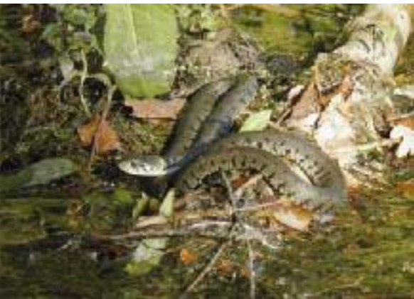
Ringelnatter beim Sonnenbaden.

Der Wohlensee nimmt im Schweizerischen Mittelland bezüglich seiner physikalischen, biologischen und ökologischen Entwicklungsmöglichkeiten eine besondere Stellung ein. Die grosse Bedeutung liegt vor allem in der hohen Dichte an ökolo-