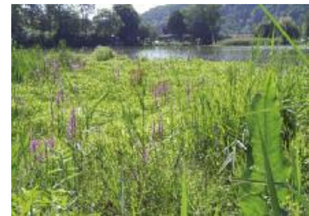
Pioniervegetation in der Inselrainbucht.

Nach dem Mittagessen auf dem Floss stellte Mathias Lörtscher den Gästen das vorhandene naturräumliche Potenzial am und auf dem Wohlensee vor. Nach der Aufstauung des Wohlensees hat sich Schritt für Schritt wieder eine natürliche Ufervegetation mit Lebensräumen für eine vielfältige Tierwelt mit Rückzugs- und Ruhe gebieten entwickelt. Heute ist die Natürlichkeit und Dynamik am Wohlensee aufgrund der Seichtwasserzonen, Auflandungen, neuen Inseln mit breiten Übergangszonen zwischen Wasser und Land ausgesprochen reich und vielfältig. Dies trifft vor allem auf den Mittelteil mit seinen seichten Flachufeln und dynamischen Verlandungszonen zu, in welchem es viele Teilgerinne gibt, die sich verzweigen, mäandern, Sandbänke und natürliche Inseln gestalten. Aber auch in den Mündungen der Seitenbäche sowie den breiten vernässten, nicht landwirtschaftlich genutzten Uferstreifen konnten sich in den vergangenen Jahrzehnten viele Einzellebensräume