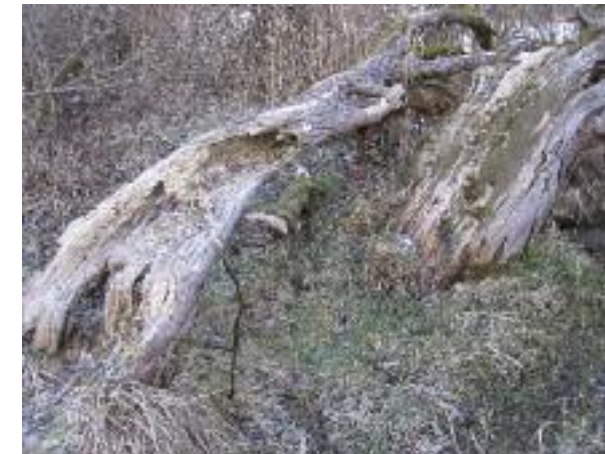
Beginn der Zersetzung.

Die Larven des Schrotbockes fressen in alten Stämmen oder Laubholzstöcken (u.a. in Eichen und Buchen) Nahrungsgänge und bauen nestartige Puppenwiegen. Diese sind bodenbiologisch bedeutungsvoll, da sie den Stockabbau fördern. Die holzabbauenden Insekten übertragen keine Krankheiten und sind für gesundes Holz nicht schädlich, was auch auf die grosse Mehrheit der baumbewohnenden Insekten zutrifft. Alte und absterbende Laubbäume beherbergen auf ihrer Rinde eine wesentlich grössere Artenvielfalt als Nadelbäume: Während auf einer Fichte bis zu 200 verschiedene Totholzbewohnende Käferarten vorkommen, sind es bei der Buche deren 600 und bei der Eiche sogar deren 900 verschiedene Käferarten.