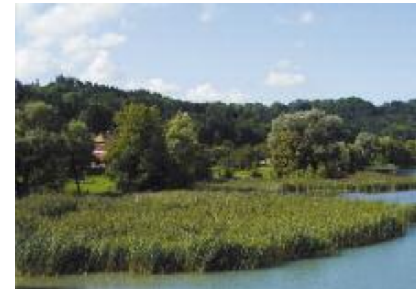
Schilfzone in der Wohlei.