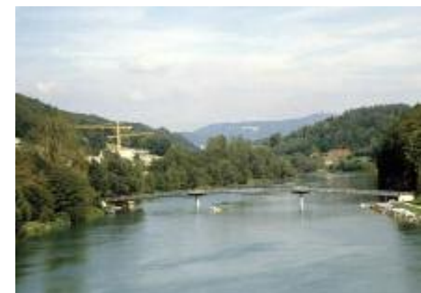
Aare zwischen Hasli und Kappelenbrücke 1999

Felix Weibel, Bundesamt für Statistik, Sektion Geoinformation, 2010 Neuenburg