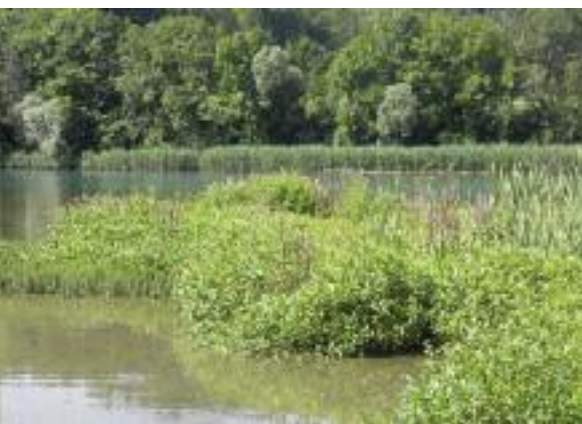
Auflandungszone mit Pioniervegetation.

Die zweite Antriebskraft der natürlichen Veränderung ist das «Bestreben» der Vegetation, an einem bestimmten Standort, angefangen