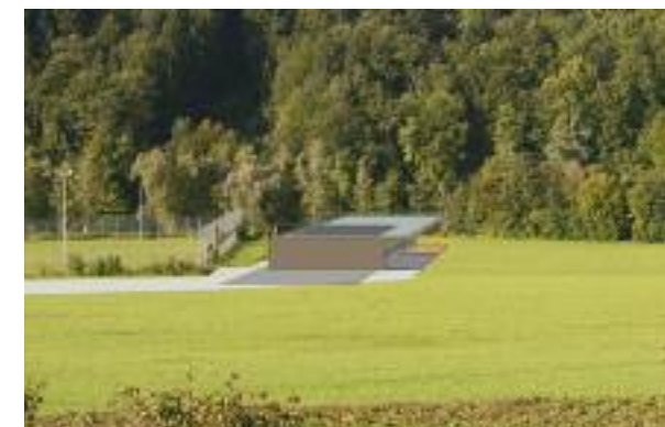
Der Standort des neues Bootshauses in der Ey.

Die Dimension des einstöckigen Gebäudes wird von der Länge der grössten Ruderboote (8-er Boote) bestimmt. Das Gebäude wird 54 Meter lang und 21 Meter breit. Der Hauptteil des Bootshauses dient als Bootsraum, die Garderoben, die sanitären Anlagen, der Trainingsbereich und der Clubraum befinden sich im kleineren Teil. Auf dem Flachdach wird eine Solaranlage installiert.