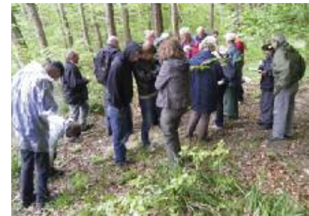
Vorbereitung auf den Rundgang.