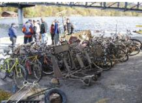
Ausbeute des «Gewässerputzete».

Nach Ablauf des Aeschenmoratoriums wurden in Zusammenarbeit mit dem Fischereinspektorat und den freiwilligen Fischereiaufsehern bei mehreren Kontrollgängen rund 200 Fischerinnen und Fischer zwischen dem Auslauf Thunersee und dem Niederriedstauwehr kontrol-