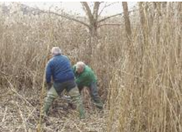
Entfernen von Weiden im Schilf.

Bei den jährlichen Pflegeeinsätzen steht jedes Jahr ein anderer Uferabschnitt zur Pflege an. Der grosse Schilfgürtel in Vorderdettigen war ein Gebiet, in welchem die Pensioniertengruppe schon seit längerer Zeit gerne aktiv geworden wäre. Während den Winterarbeiten in diesem Jahr war es nun soweit. Das Gebiet wurde im oberen Bereich auf einer Länge von vorerst 30 Metern durchforstet und die Bäume im Schilf entfernt. Die Ausholzarbeiten im Januar gestalteten sich relativ schwierig, liessen sich die alten Weidenbüsche wegen des gefrorenen Bodens doch nur mühsam ausstocken. Die getroffenen Massnahmen zum Schutz des Schilfes bilden nun wieder optimale Voraussetzungen als Brut- und Laichgebiete und Kinderstuben für