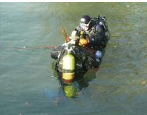
Vorbereitung eines Tauchgangs.

In Zusammenarbeit mit der Tauchergruppe der Sanitätspolizei Bern und der Kantonspolizei Bern, der Seepolizei Wohlensee fand eine separate konzentrierte Grossaktion statt, anlässlich welcher die Brücken, Neubrücke, Halenbrücke, Stegmattsteg, Kappelenbrücke und Wohleibrücke betaut wurden. Auch in diesem Jahr wurden in aufwändigen Tauchgängen wieder zahlreiche fahrlässig entsorgte Gegenstände unter den Brückenübergängen geborgen. Dabei leistete das Polizeiboot P31 mit Kranausrüstung auch in diesem Jahr wieder sehr wertvolle Dienste, um die 35 bei den Brückenübergängen im See entsorgten Velos, Registrierkassen, Pneus, Teilen von «Robi-Dog-Behältern» so-