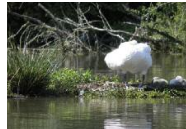
Bezug der ersten Auflandungsfragmente.

Erst wenn das Längenwachstum im Wohlensee beendet ist und sich auf den Sandbänken eine geschlos-