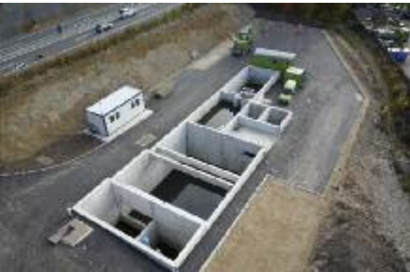
SABA Hallmatt, Autobahnabschnitt Niederwangen.