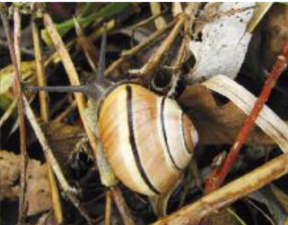
Häuschenschnecke auf dem Waldboden.

der Bänderschnecken sind durchsichtig-beige und färben sich nur langsam; erst gegen Winter oder im nächsten Frühjahr entwickeln sich aus den fast farblosen Schalen die schönsten rosa- oder gelb-farbenen und schwarz gestreiften Häuschen.