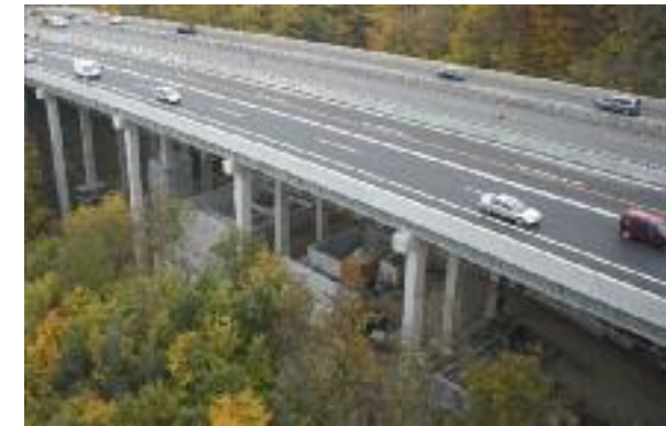
Ittgrabenviadukt mit SABA Wylerholz im Rohbau.