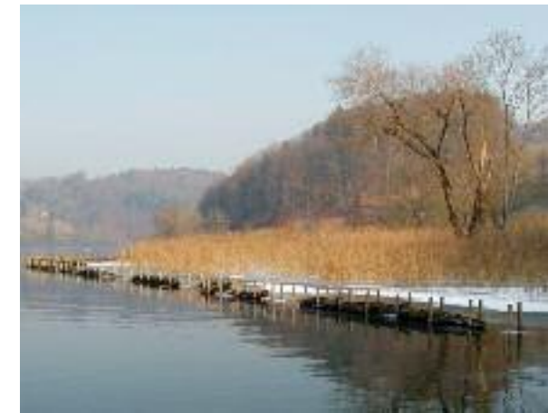
Lahnung in der Jaggisbachau.