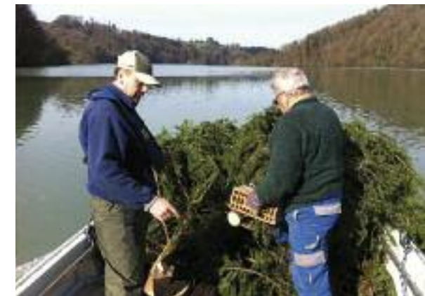
Vorbereitung für das temporäre Einbringen von Tannenbäumen.

Projektgruppe Wohlensee der Fischerei-Pachtvereinigung Bern und Umgebung und Mitglieder der Pensioniertengruppe