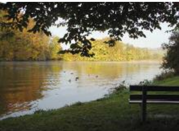
Flusslandschaft in der Ey.

Landschaften sind Orte des Wirtschaftens für die Land- und Waldwirtschaft, für die Industrie und das Gewerbe einschliesslich der Dienstleistungen (Gesundheit, Wellness, Tourismus). Die Standortattraktivität und die Lebensqualität eines Ortes hängt