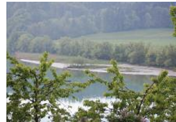
Auflandungszone mit Schilfgürtel im Aufeld.

Das ermittelte Wissen der Vorstudie sowie aus der Verlandungsstudie Wohlensee, die Ökomorphologiestu-