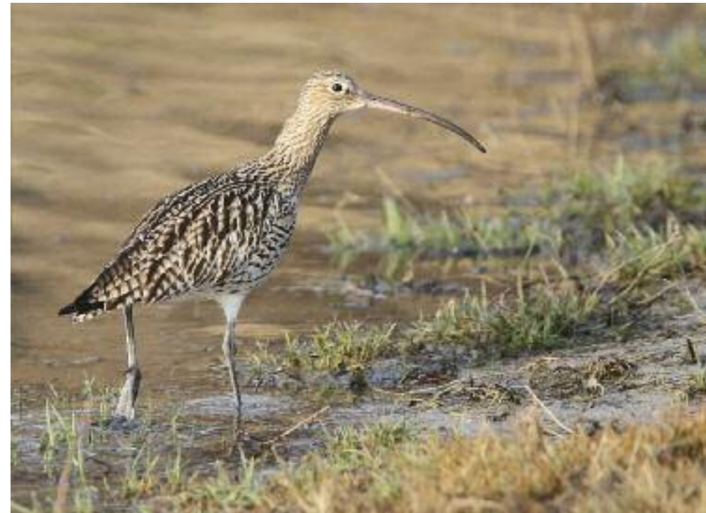
Brachvogel im Schlick.

Zu den auffälligsten Arten gehört u.a. die Graugans. Ca. 300–500 Individuen ruhen sich regelmässig auf den Sandbänken aus. Zur Nahrungssuche begeben sie sich mehrmals täglich auf den abgeernteten Maisäckern und Wiesenflächen der Strafanstalt Witzwil. In den letzten Jahren hat nicht nur die Zahl der Wintergäste am Neuenburgersee sondern auch die der Übersommerer zugenommen. Dies steht im Zusammenhang mit der Ausbreitung der Art im westlichen Mitteleuropa, die teilweise