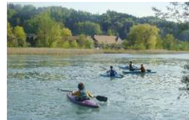
Kanufahrende bei der Wohleibrücke.