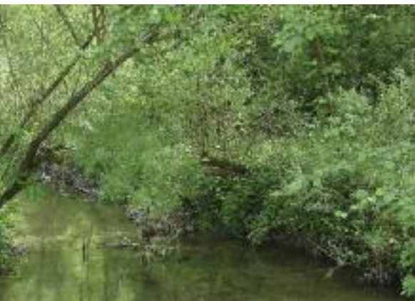
Besatz eines Zuflussgewässers.

Mit dem Besatz von Elritzen in den Zuflüssen des Wohlensees wird das Ziel, der späteren Abwanderung auf natürlichem Weg in das Hauptgewässer und deren Ansiedlung als beständige Population verfolgt. Die erste Etappe wurde im 2010 und die zweite Etappe im 2011 mit dem Einsetzen von je 500 Fischen erfolgreich abgeschlossen. Der Aussatz von weiteren 500 Elritzen wird im 2012 im Wohlensee im gleichen Umfang weitergeführt. Danach wird das dreijährige Projekt «Förderung der Elritzen» mittels einer gezielten Erfolgskontrolle ausgewertet.