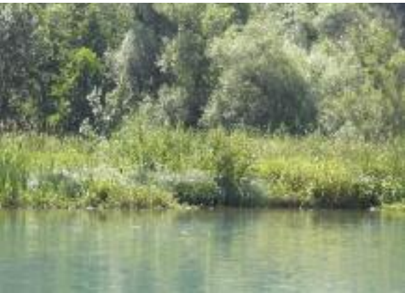
Gestufte Ufervegetation Eymatt.

Über den Wohlensee und dessen Uferlebensräume bestehen zahlreiche Grundlagen, Entwicklungskonzepte und konkrete Massnahmenvorschläge. Einen besonderen Stellenwert nimmt dabei das Uferschutzkonzept von SVW und BKW ein, in welchem 1995 sowohl generelle Ziele als auch detaillierte Pflege- und Gestaltungsvorschläge erarbeitet wurden. Zur Gewährleistung einer – den aktuellen Gegebenheiten entsprechenden – fachgerechten Pflege liess die BKW FMB Energie AG in enger Zusammenarbeit mit dem Schutzverband Wohlensee ein neues Pflegekonzept Wohlensee ausarbeiten.