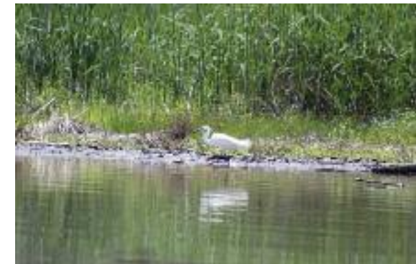
Seidenreier bei der Nahrungssuche in den Flachwasserzonen.