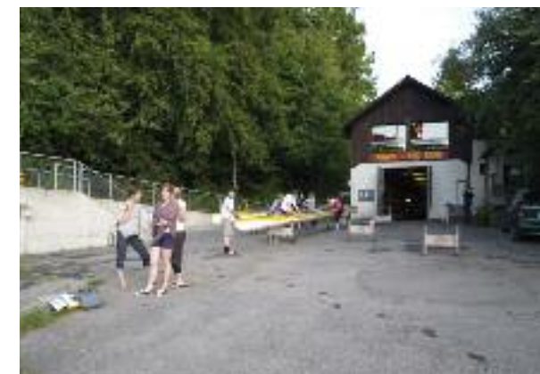
Das alte Bootshaus in der Eymatt.

Anlässlich des 25. Armadacups im Oktober wurde das Projekt ebenfalls vorgestellt, wurde dieser Anlass doch das letzte Mal in den alten Gemäuern durchgeführt. Zahlreiche