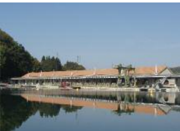
Wasserkraftwerk in Mühleberg.

Die BKW ist sich der hohen Bedeutung des Wohlensees und des Kraftwerkes bewusst. In den vergangenen 20 Jahren wurden des-