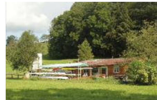
Das provisorische Bootshaus in der Talmatt.

sich als bestmögliche Variante erwiesen, der sich in der richtigen Zone für Sport und Freizeitnutzung befindet. Die Eigentümerin der Parzelle, die BKW FMB Energie AG wie auch der angrenzende Landeigentümer haben dem Projekt zugestimmt. Das Ein- und Auswassern ist unproblematisch, wie auch die verkehrsmässige Erschliessung. Da das Rudern kein Massensport ist und keine Grossveranstaltungen nach sich zieht, wird es auch kaum zu Mehrverkehr kommen.