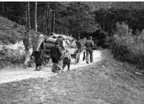
Heimfuhr der Buchenlaubernte.

das klingeldürre Buchenlaub zu einem grossen Haufen in eine Mulde, wo die Bettziechen gefüllt werden ... Langsam dehnt sich die Hülle über dem dünnen vielfarbigem Segen, aus dem die Kinder sorgfältig alle Ästchen und Igel, das heisst die stacheligen Buchenfrüchte, entfernen. Denn bitter rächt sich jede Unterlassungssünde. Trotz gutem Gewissen ist dann das Lager kein sanftes Ruhekissen» (Brockmann-Jerosch 1928). Um die Säcke prall zu füllen, wurden die trockenen Blätter