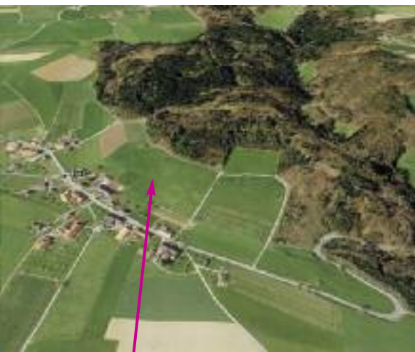
Luftaufnahme der zugeschütteten Deponie Illiswil.

Das Ziel ist von beiden Varianten dasselbe: «Die Qualität des Wassers muss künftig unterhalb der Deponie genauso gut sein wie oberhalb.