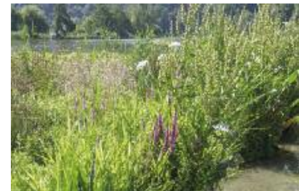
Pionierpflanzen auf der grössten Insel im Wohlensee.

Das Wassers hat für alle Lebensvorgänge und alle vom Wasser dominierten Lebensräume (stehende oder fließende Gewässer, Seichtwasser-, Flachwasser- und Auflandungszone sowie Feuchtgebiete und Flussauen) eine hohe ökologische Bedeutung sowohl für deren Haushalt wie auch für die Entwicklung.