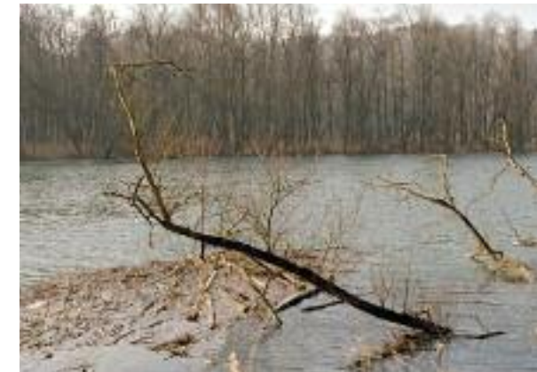
Schwemmholz auf dem Wohlensee nach starken Regenfällen.

An dieser Stelle danke ich allen, die bei der Pflege der Natur am Wohlensee mitgewirkt oder uns in irgend einer Form unterstützt haben: den Männern für ihren Einsatz an der Front und ihren Frauen für das Wirken im Hintergrund, der BKW und den Gemeinden für die finanzielle Unterstützung, dem Amt für Landwirtschaft und Natur des Kantons Bern und dem Schutzverband Wohlensee für die Beratung und Begleitung. Ohne Engagement und Unterstützung aller Mitwirkenden, könnten die Mitglieder der Pensioniertengruppe, die vielen verschiedenen Aufgaben im gewünschten und heute praktizierten Rahmen nicht wahrnehmen.