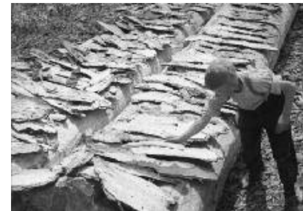
Rüsten und Trocknen der Baumrinde.

Der forstliche Waldfeldbau breitete sich in der Schweiz rasch aus, da er sowohl den Bedürfnissen der aufkommenden Forstwirtschaft als auch dem zunehmenden Landbedarf einer wachsenden Bevölkerung entgegenkam. Das forstliche Interesse bestand vor allem in der geregelten, auf Nachhaltigkeit ausgerichteten Holznutzung. Diese erreichten die Forstleute zu Beginn des 19. Jahrhunderts vor allem durch den schlagweisen Hochwaldbetrieb und die Verjüngung mittels Pflanzung. Für das Setzen der jungen Bäume nach dem vollständigen Kahlschlag entfernte man in der Regel die Wurzeln der gefälltten Bäume, dann bearbeitete man den Boden gleichmässig und säte bzw. pflanzte den Nachfolgebestand. Die Verpachtung der Felder diente aber auch dazu, die aufkommende Forstwirtschaft bei der Bevölkerung beliebter zu machen und den Rodungsdruck in Zeiten von Nahrungsmittelknappheit zu reduzieren.