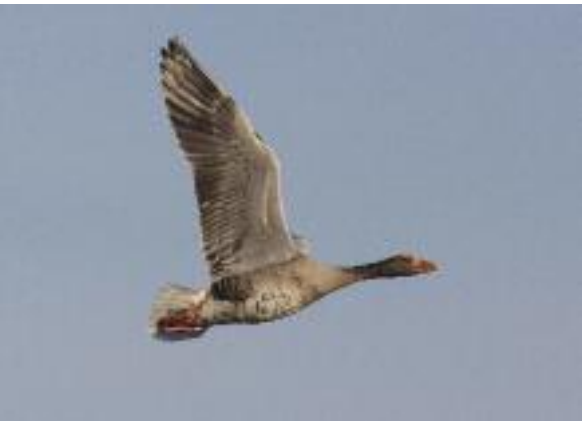
Elegant fliegende Graugans.

se auf Gefangenschaftsflüchtlinge zurückzuführen ist. Bemerkenswert ist zu dieser Jahreszeit auch das Auftreten der Kolbenente. Diese knapp stockentengrosse Tauchente kommt in Europa im Mittelmeerraum, im südlichen Mitteleuropa und bis zum Kaspischen Meer vor. Im Winterhalbjahr sind jeweils mehrere Tausend dieser prächtigen Entenart am Neuenburgersee zu sehen. Sie ernährt sich vorwiegend von Armleuchteralgen. Die Zunahme der Kolbenente in der Schweiz steht wohl im Zusammenhang mit der Ausbreitung dieser Algen in den Schweizer Seen dank verbesserter Wasserqualität, mit der Abgrenzung grösserer Schutzzonen sowie dem Austrocknen von Gewässern in Spanien aufgrund von Trockenperioden. Die verschiedenen Buchten und Flachwasserzonen entlang der Grande Cariçaie bilden da ideale Nahrungsplätze für die Kolbenente.