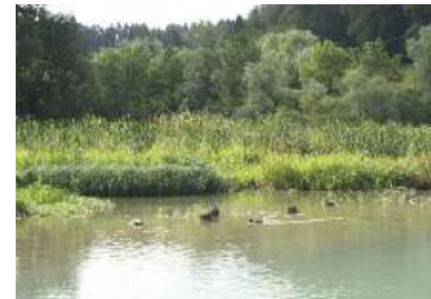
Gestufte Uferstruktur unterhalb Gäbelbachdelta.