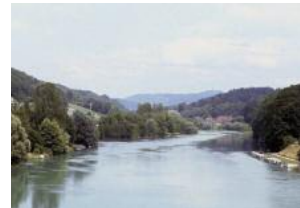
Aare zwischen Hasli und Kappelenbrücke 1998

Aktuelle Ergebnisse und Informationen zur Arealstatistik finden Sie im Internet unter www.statistik.ch im Themenbereich 02 Raum und Umwelt.