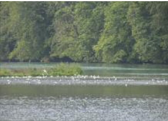
Möwen bevölkern neue Inseln.

die Wohlensee sowie vom Pflegekonzept Wohlensee sind in der Hauptstudie des Ökologischen Gesamtkonzeptes eingeflossen.