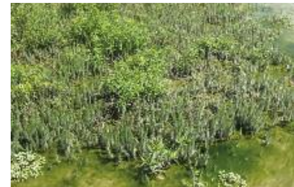
Tannenwedel, eine typische Sumpfpflanze in den Randzonen jeder Insel.

Die Zonen auf den Inseln sind fliessend und verändern sich von Jahr zu Jahr. Die Zentralzone mit hohem Schilf dehnt sich immer mehr nach aussen aus und verdrängt die Pflanzen der Übergangszone. Damit