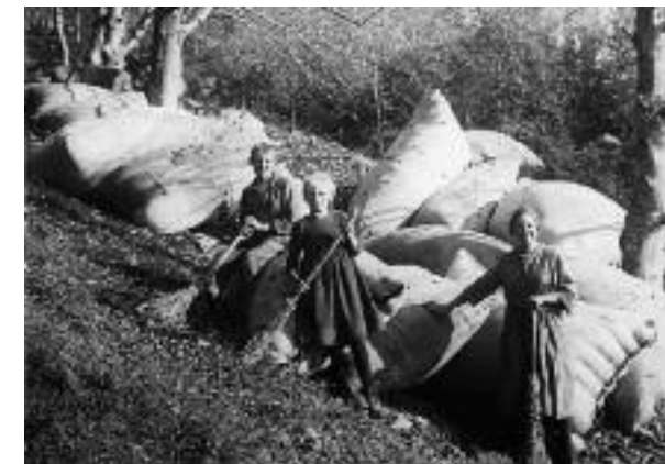
Buchenlaubernte, abgefüllt in Säcke.

Wie verbreitet die Streunutzung war, sehen wir darin, dass Kasthofer 1818 im Berner Oberland keinen ein-