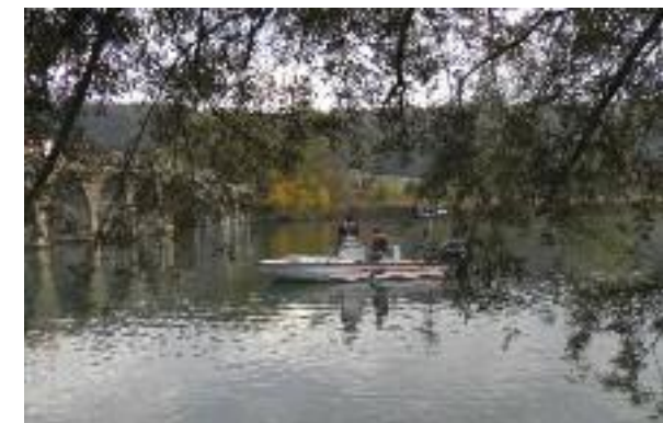
Die Seerettung Thunersee war beim Armadacup mit sieben Booten im Einsatz.