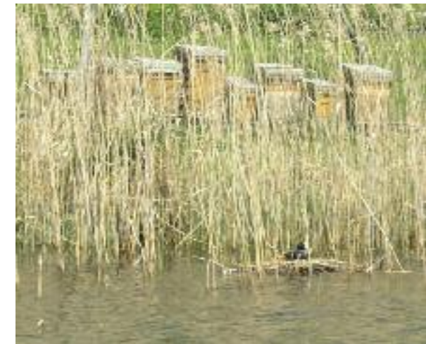
Bienenkästen am Wohlensee.

Die kleinste Biene ist die Arbeiterin . Die Arbeiterinnen putzen nach dem Schlüpfen als junge Bienen zuerst die Zellen. Am Kopf der Arbeiterin sitzen Drüsen, aus welchen nach sechs Tagen Futtersaft fliesst, mit welchem sie den Nachwuchs in den Zellen füttert. Sobald die Arbeiterin zehn Tage alt ist, wird sie Wächterin und verteidigt den Stock beim Flugloch/Flugbrett. Die Arbeiterinnen verteidigen den Stock, indem sie ihre Feinde mit ihrem Giftstachel stechen. Erst in den letzten zehn Tagen ihres kurzen Lebens werden die Arbeiterinnen Sammelbienen und erkunden in kurzen Flügen die Umgebung von ihrem Stock. Nach zwanzig Tagen beginnt bereits die letzte Etappe ihres Lebens, in welcher sie den Stock verlassen, um Nahrung (Nektar, Pollen, Wasser und Propolis) zu sam-