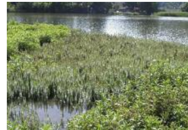
In der Schweiz selten: Tannenwedel.

Die Randzone ist jener Teil der Insel, der, je nach Pegel, mal trocken und mal von Wasser bedeckt ist. Nur wenigen Sumpfpflanzen gelingt es, sich diesen Bedingungen anzupas-