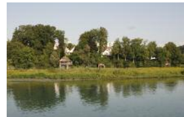
Nickender Zweizahn in der Inselrainbucht.