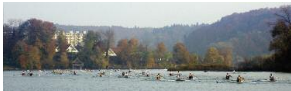
Spitzenathleten der internationalen Ruderszene auf dem Wohlensee.

Im 2011 feierte der BKW Armadacup das 25-jährige Jubiläum. Was 1987 mit einem Langstreckenrennen mit Massenstart begann und damals knapp 80 Ruderinnen und Ruderer nach Bern lockte, ist heute zu einem nationalen Grossanlass mit internationaler Beteiligung herangewachsen. 1200 Ruderer, Drachenbootfahrer und Paddler messen sich während drei Stunden auf dem Wohlensee.