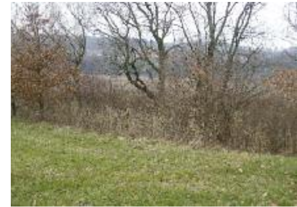
Schilfzone mit rückwärtiger Vernetzung Aufeld.

Die Ufervegetation ist gesetzlich geschützt. Mit dem Pflegekonzept Wohlensee 2011 werden die fachlichen Voraussetzungen geschaffen, um eine aktuelle, den Zielen des Naturschutzes und Landschaftsschutzes entsprechende Uferpflege im Raum Wohlensee zu gewährleisten.