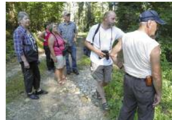
Beobachtungen anlässlich der Waldexkursion.

Der Wald ist ein naturnaher Lebensraum für zahlreiche Pflanzen und Tiere. Er liefert den nachwachsenden