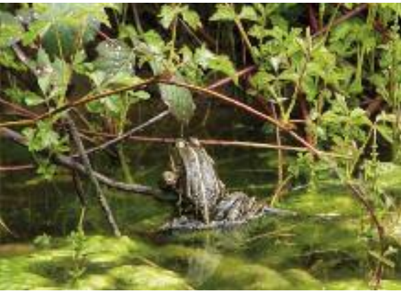
Frosch in einer Seichtwasserzone.

ausbilden, die von der Höhe des Grundwasserspiegels und den Lichtverhältnissen beeinflusst werden in welchen sich viele seltene Arten von Amphibien, Reptilien, Insekten, Wasservögeln, Röhrichtbewohner, Fische, Mollusken, Biber usw angesiedelt haben.