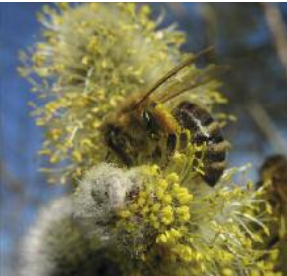
Bienen bei der Nektaraufnahme.

ten und ihn danach in die Zellen zu stopfen.