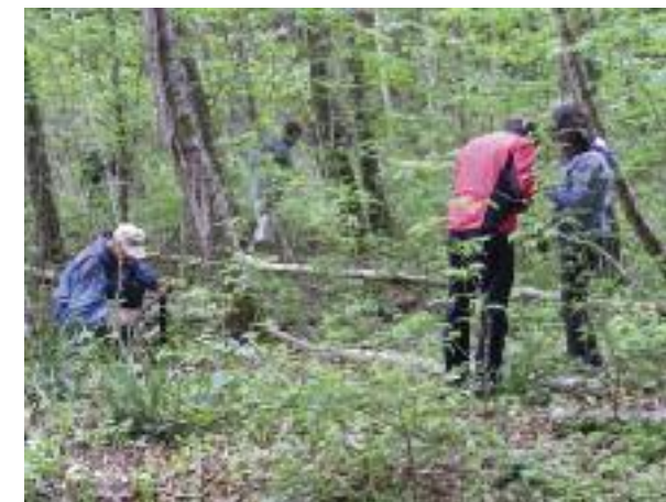
Auf der Schneckensuche.

Sobald es im Frühling wärmer wird, erwachen die Schnecken und kommen aus ihren Verstecken hervor. Die Weinbergschnecken brechen den Kalkdeckel an ihrem Gehäuse am Rand mit dem Fuss auf. Diese «Tür» lassen sie liegen, kriechen durch die Erde an die Oberfläche und suchen sofort hungrig nach Nahrung, um schnell wieder an Gewicht zuzunehmen und lebensfähig zu werden. Nicht alle Schnecken überleben den Winter, da einige verhungern oder austrocknen. Dies trifft zu, wenn sie sich vor dem Winter nicht genügend Vorrat angefressen haben, der Winter sehr hart war oder wenn sie ei-