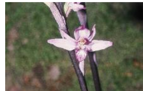
Blüte des Violetten Dingels.