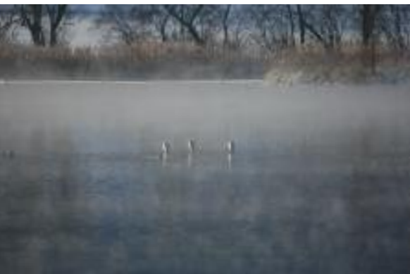
Silberreiher bei der Rast auf dem Wohlensee.