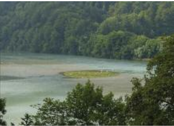
Flachwasser- und Verlandungszone.

betroffenen Bäche und Flüsse ihrer natürlichen Funktionen beraubt und dienen nur noch als Abflussrinnen. In der Zwischenzeit hat sich die Philosophie geändert. Gewässer sollen wieder naturnahe Flusslandschaften und Lebensräume für viele Arten sein und bedeutend mehr Raum erhalten als bisher. Seichte Uferzonen, Flachwasser- und Auflandungszone sind heute Querschnittsaufgaben von Ökologie und Hochwasserschutz.