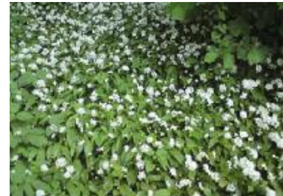
Bärlauch, eine typische Pflanze auf feuchten Böden.