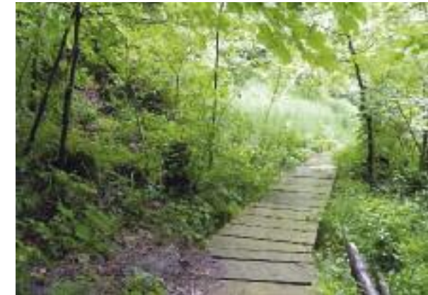
Waldgebiet im Bereich des Mühlebachs.