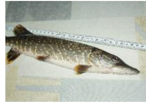
Hecht aus dem Wohlensee, Todesursache unbekannt.

FU haben im ARA-Auslauf jeweils 60 bis 70 ausgewählte organische Spurenstoffe nachgewiesen, deren Gesamtkonzentration überall 50 Mikrogramm pro Liter überschreitet. Die Summe sämtlicher Substanzen und ihrer zum Teil ebenfalls giftigen Umwandlungsprodukte dürfte jedoch deutlich höher liegen. Am stärksten belastet sind kleine bis mittlere Fließgewässer im dicht besiedelten und intensiv genutzten Mittelland, in denen das aus Kläranlagen eingeleitete gereinigte Abwasser ungenügend verdünnt wird. Insbesondere bei Niedrigwasser ist hier davon auszugehen, dass die ökotoxikologischen Qualitätskriterien für verschiedene organische Spurenstoffe durch den permanenten Eintrag solcher Mikroverunreinigungen mehrfach überschritten werden.