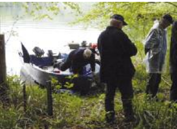
Ankunft im Flühgrabenrain.

Die verschiedenen Schneckenarten entwickeln sich unterschiedlich. Das Gehäuse der Weinbergschnecke ist grau-braun, während das Haus der Gefleckten Schnirkelschnecke braun-rot ist. Die Schalen