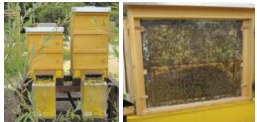
Bienenhäuser, der sogenannte «Stock», mit mehreren Holzrahmen.

Früher lebten die Honigbienen in Hohlräumen von Bäumen oder Höhlen; heute leben sie in Bienenhäusern (dem sog. «Stock»), in welchem mehrere Holzrahmen nebeneinander stehen. In diesen Wohnungen bauen sich die Bienen kleine sechseckige Zellen aus Wachs. Mit dem «Schwitzen» aus ihren Wachsdrüsen stellen Sie den Wabenbau her, versorgen die Brut und legen Vorräte an. Die Bienen benötigen nur einen Teil des Nektars als Nahrung für sich selbst. Den Rest wandeln sie in ihrem Magen zu Honig um, womit sie bereits auf dem Rückflug zum Stock beginnen. Im Stock angekommen, würgt die Biene den Nektar wieder heraus, welcher von den Arbeiterinnen aufgenommen wird, um ihn in ihren Mägen zu fertigem Honig zu verarbeiten.