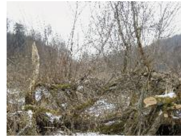
Ausholzarbeiten im Winter.

Nach den Pflegemassnahmen im Winter wird der ganze Seebereich in der Sommersaison von den Neophyten befreit. In den vergangenen Jahren hat sich das Drüsige Springkraut entlang der Uferzonen und Seitenbäche sowie in den Bachdeltas mas-