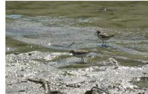
Flussuferläufer bei der Nahrungssuche in den Schlickzonen.