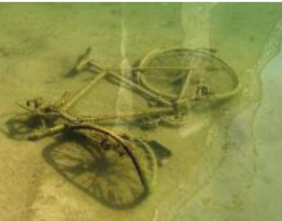
Entsorgtes Velo in der Flachwasserzone.

viele Ohrenwattestäbchen und zahlreiche schwarze und weisse zahnradähnliche Filterteilchen, die vor einem Jahr irrtümlich aus den Becken des Tropenhauses Frutigen entwichen waren und sich in den Ufern verfangen haben, herausgefischt. Aufgrund der bisherigen Erfahrungen hat sich gezeigt, dass der meiste Unrat von der «Bise» und dem «Westwind» verfrachtet in die entsprechend exponierten Buchten geschwemmt werden. Besondere Rätsel geben der Seepolizei und den Mitgliedern der Pensioniertengruppe