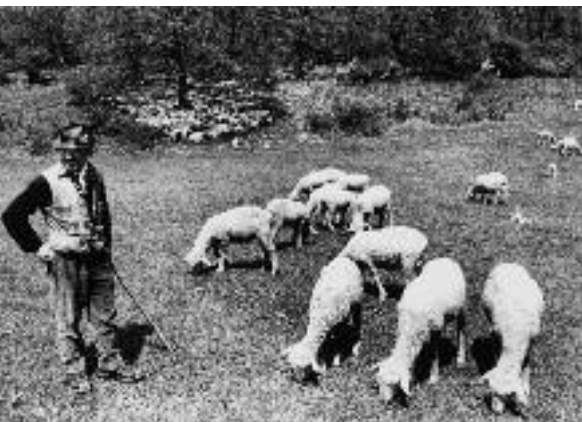
Waldweide mit Schafen.

Länger dauerte es hingegen, bis die Bauern die Waldweide von Kühen, Ziegen und Schafen aufgaben. Nur in einzelnen forstlich intensiv genutzten Stadtwäldern hörte man bereits im ausgehenden 18. oder frühen 19. Jahrhundert damit auf, die Tiere in den Wald zu treiben. Im ersten Drittel des 19. Jahrhunderts befassten sich zahlreiche kantonale Gesetze mit der generellen Aufhebung oder Ablösung von Waldweiderechten. Da die Einhaltung der Gesetze kaum kontrolliert werden konnte, blieb der Erfolg dieser Erlasse gering. Bis um die Mitte des Jahrhunderts war die Waldweide im schweizerischen Mittelland mindestens für das Grossvieh kaum noch üblich. Die Förster wollten die Waldweide nicht mehr dulden, und die Bauern waren auf sie nicht mehr angewiesen. Zudem trieben sie die hochgezüchte-