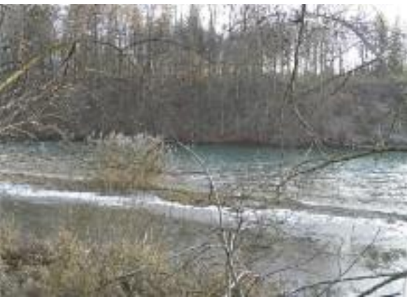
Seichtwasserzone mit beginnender Auflandung.

Die Prozesse laufen in den drei Abschnitten völlig unterschiedlich ab, wobei die Grenzen zwischen den Abschnitten fließend sind. Diese werden vom Grad der Verlandung, der Wasserspiegellage und vom Abfluss und der Sedimentzufuhr aus