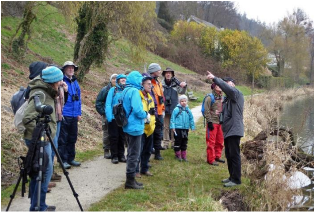
„Vögel für Anfänger“, Wohlensee, 17.3.18