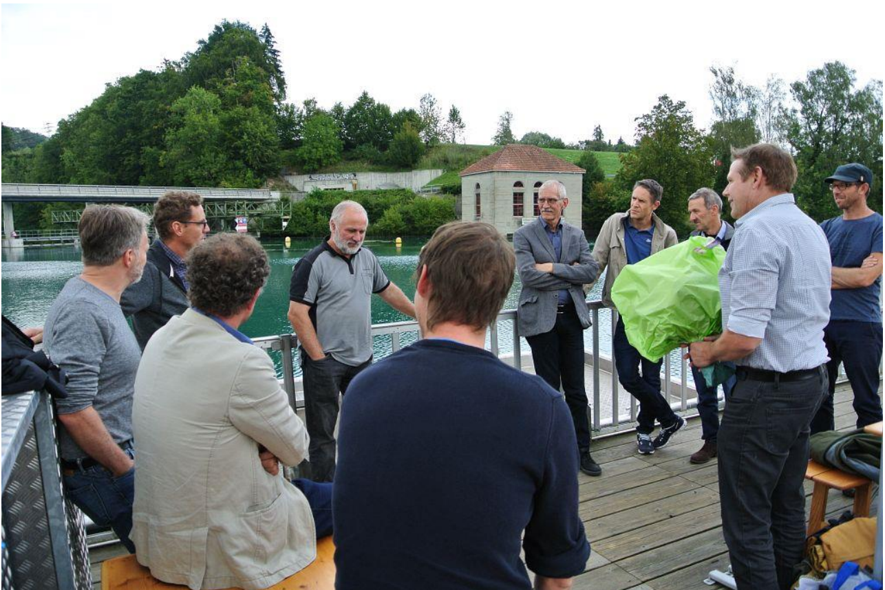
Die Vertreter des Schutzverbandes und der Einwohnergemeinden bei der gemeinsamen Flossfahrt