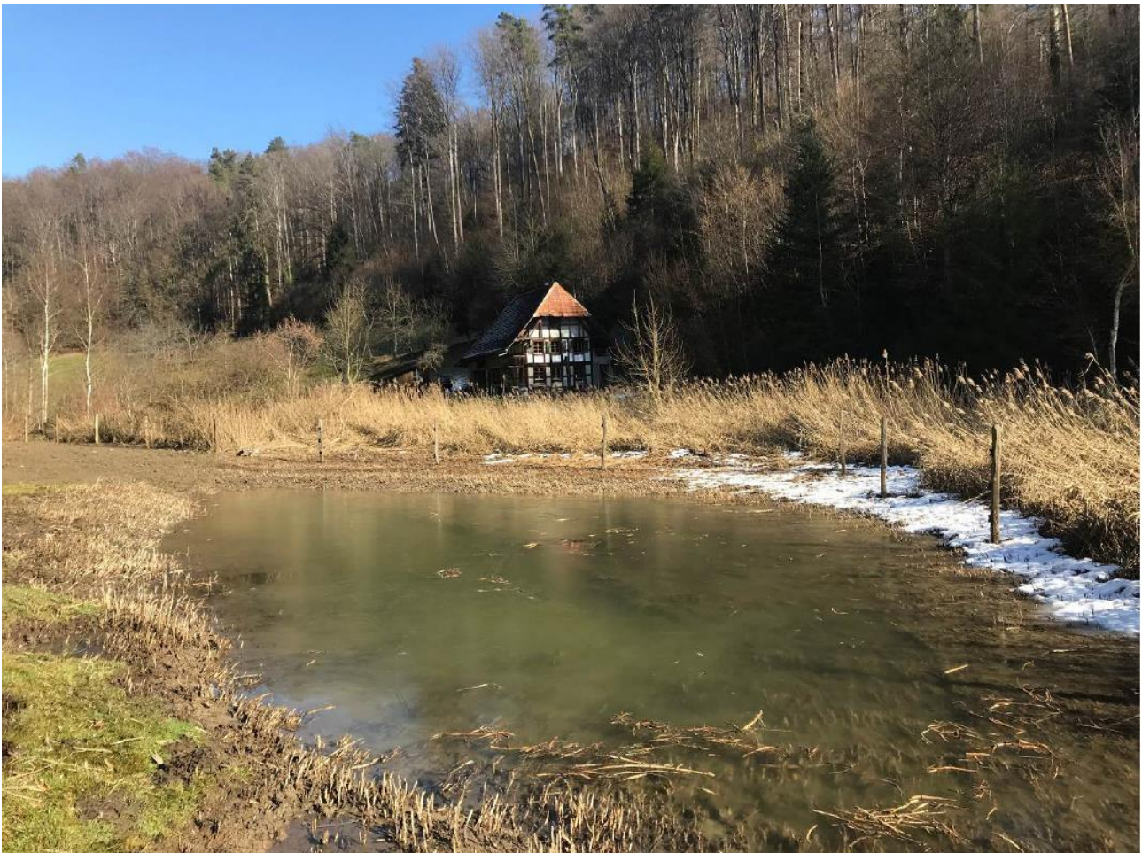
Neuer Tümpel direkt nach der Erstellung, durch Hangwasser und Niederschläge gefüllt

Der Schutzverband Wohlensee (SVW) erarbeitete 2012 ein ökologisches Gesamtkonzept, in welchem der Zustand und die Lebensraumentwicklung des Wohlensees zusammengefasst sowie Entwicklungsziele und potenzielle Aufwertungsmaßnahmen definiert wurden (alnus AG, WFN). Eine dieser Massnahmen war die Aufwertung der Leubachbucht, welche sich im Perimeter eines Amphibienlaichgebiets von nationaler Bedeutung befindet.