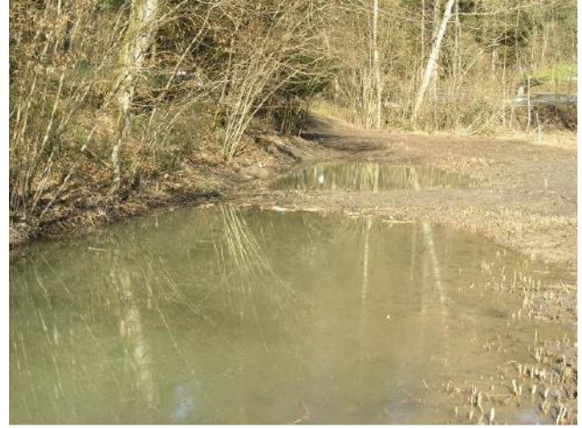
Die Tümpel wurden wieder hergestellt und die beschattenden Gehölze entfernt