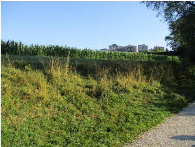
Der Standort des Entnahmebauwerks mit dem Kappelenring im Hintergrund

Im Jahresbericht 2017 wurde über das Projekt Wärmeverbund Kappelenring berichtet. Die Projektpläne waren damals brandneu und die Gemeinde Wohlensee hat über die Zielsetzung informiert, bereits auf die Heizperiode 2018/19 erste Gebäude im Kappelenring mit Wärme aus dem neuen Verbund zu versorgen.