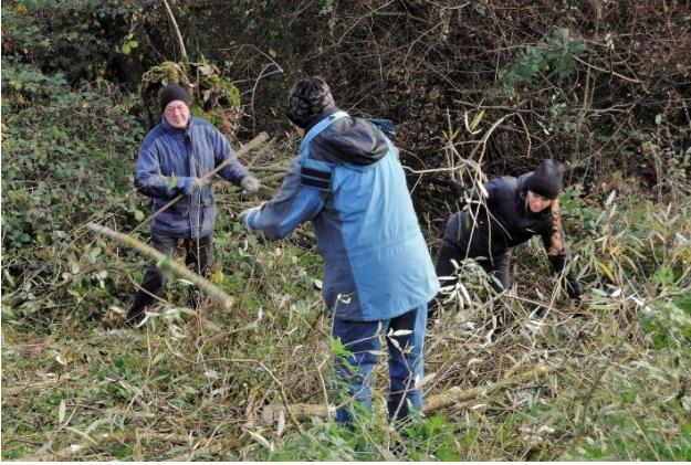
Heckenpflege Oberdettigen, 17.11.18