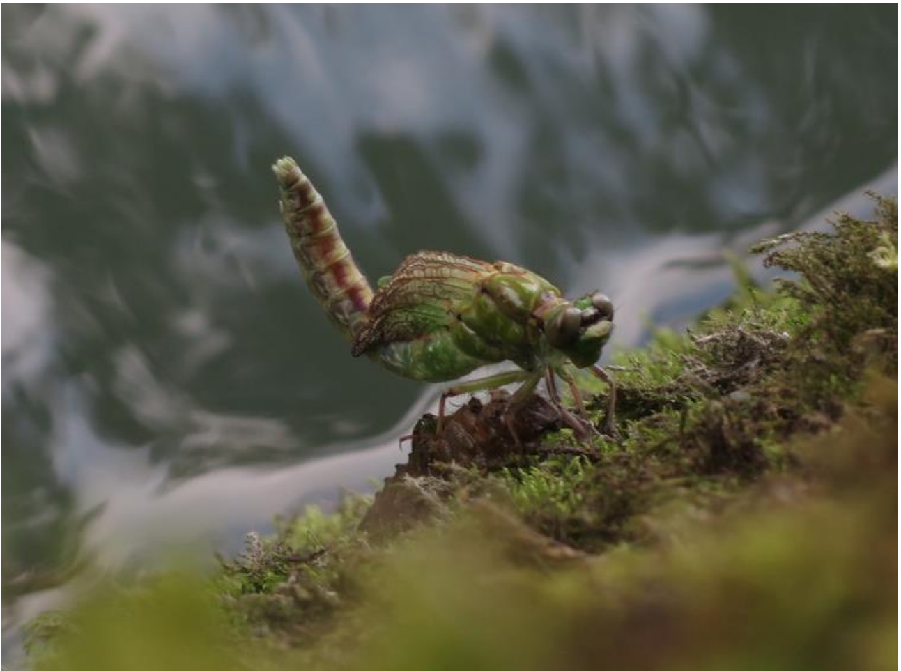
Eine Grüne Flussjungfer nach dem Schlupf an der Ufermauer beim Stegmattsteg

Westlich des Stegmattsteges plant der Kanton den Neubau des Bootshauses für die Seepolizei. Für das Projekt wurde im Rahmen einer Standortabklärung die Lage des Bauperimeters am Wohlensee-Ufer festgelegt, die Voranfrage für das Bootshaus am Wohlensee wurde vom Regierungsrat im Juni 2018 positiv beurteilt.