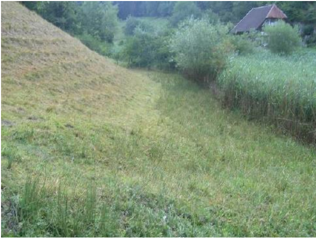
Hangfuss am Standort des neuen Tümpels vor der Ausführung