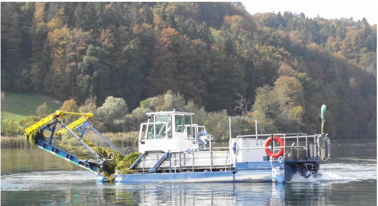
Seegras mähen auf dem Wohlensee

Neben dem Pflegeplan sind auch die gesetzlichen Vorgaben auf guten Weg. Für die Fischaufstiegshilfe ist der Baubewilligungsantrag noch im Frühling 2019 geplant.