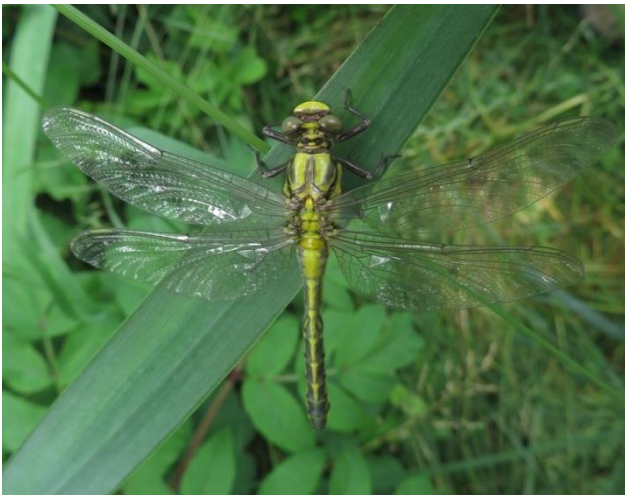
Gemeine Keiljungfer vor dem Jungferflug