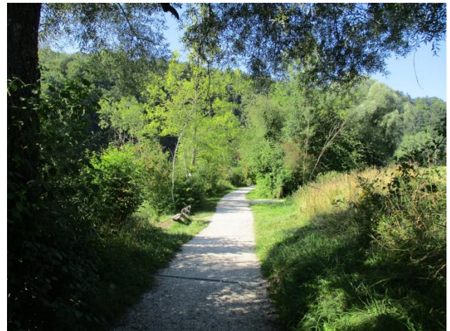
Der Uferweg im Bereich des geplanten Entnahmebauwerks. Die Sitzbank steht auf der Parzelle des SVW

Die Parzelle auf der das Entnahmebauwerk des Verbunds gebaut werden soll, gehört dem Schutzverband. Die für das Projekt verantwortliche Unternehmung Energie 360° aus Zürich hat dem Vorstand des SVW das ganze Vorha-