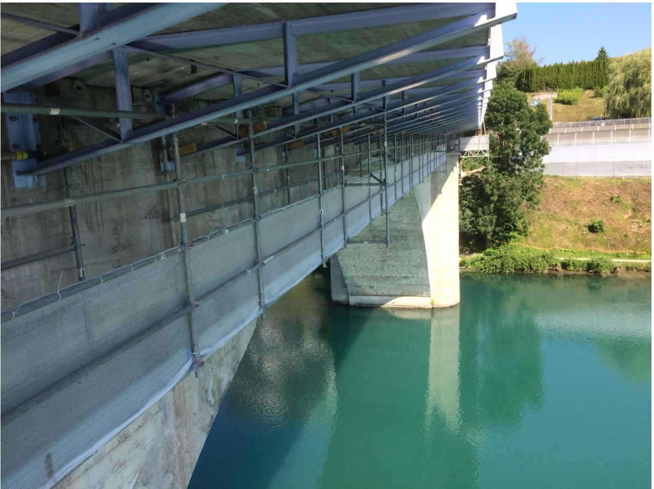
Kappelenbrücke mit Mauerseglerfreundlichen Netzen, 9.7.18