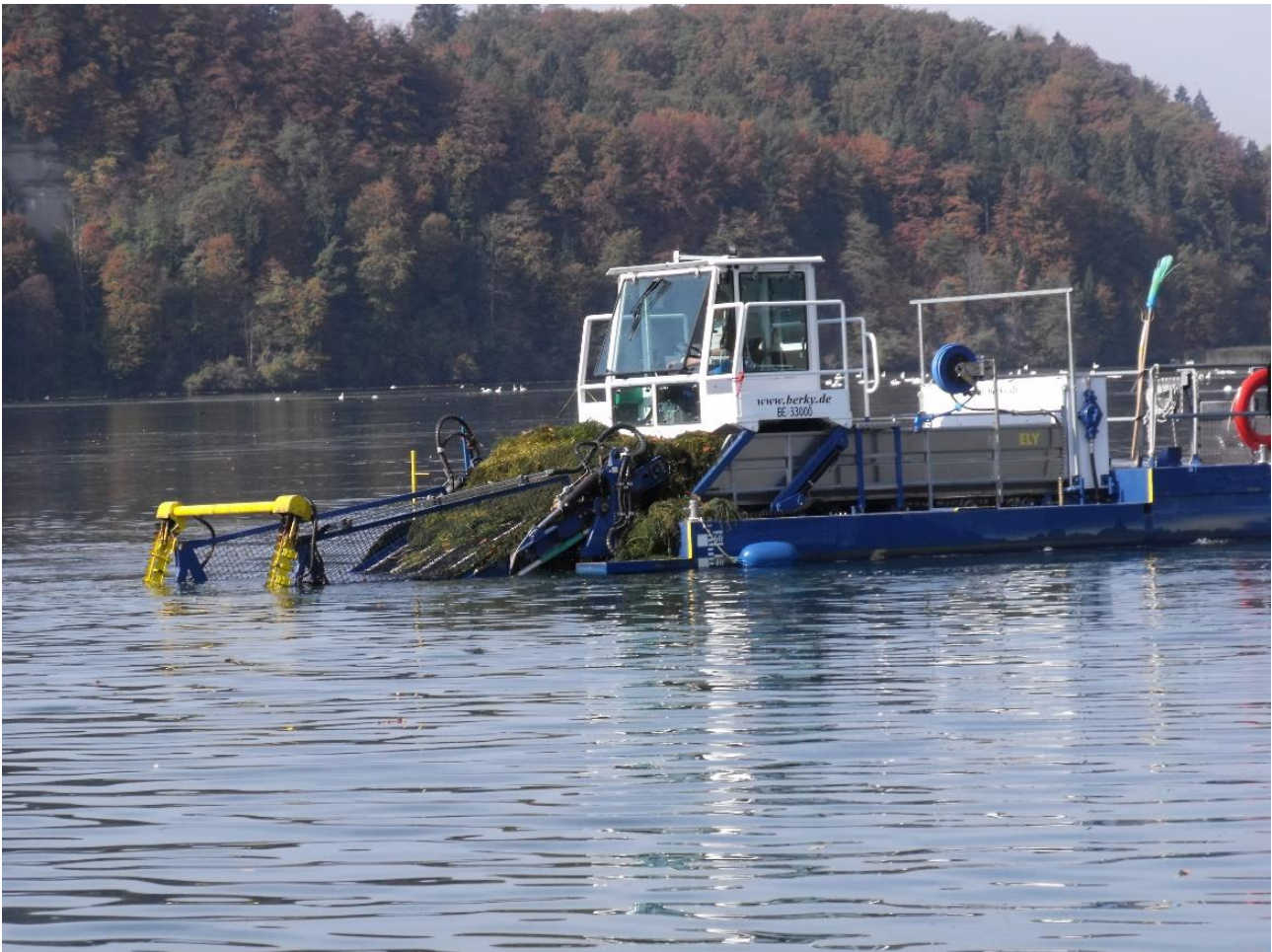
Seegrasmähen auf dem Wohlensee