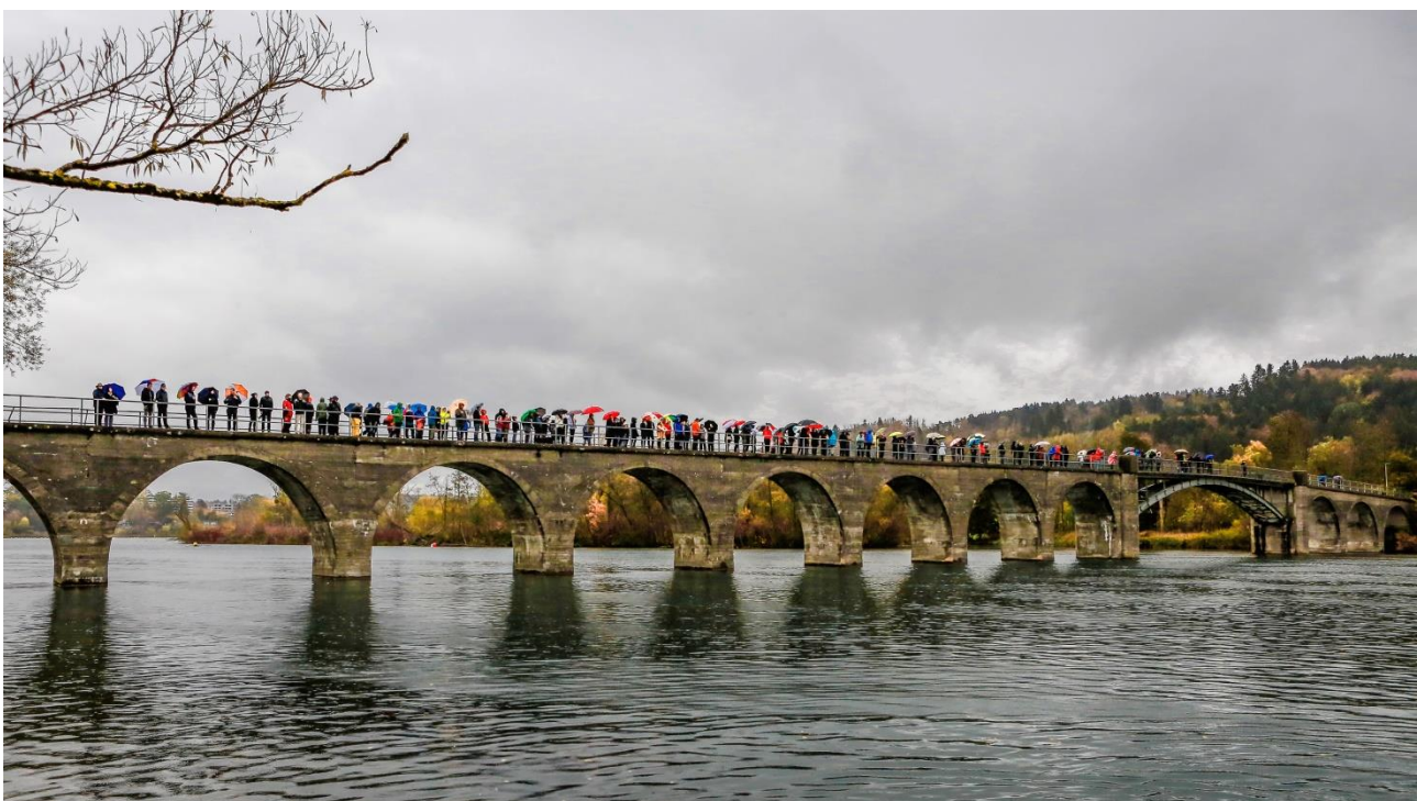
Zuschauer auf der Wohlei-Brücke