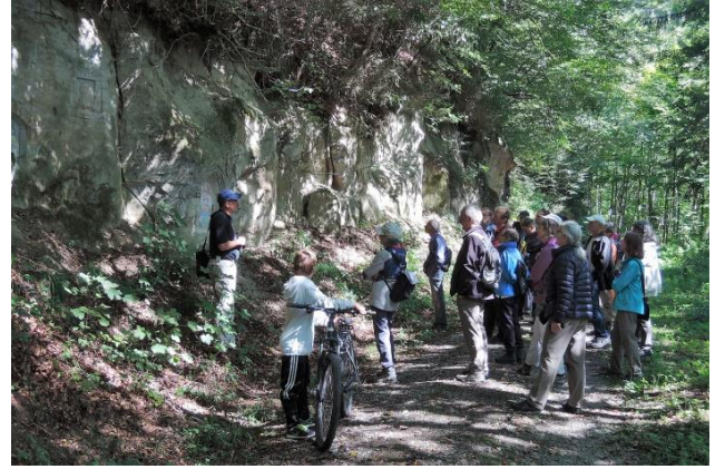
Geologischer Rundgang Steinisweg, 26.8.18