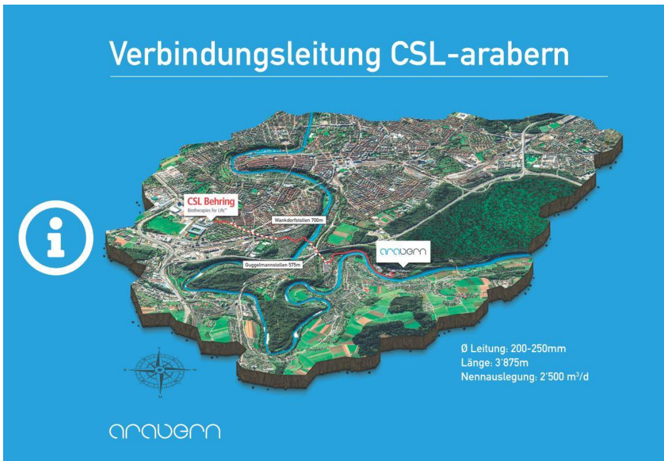
Situation Verbindungsleitung CSL-arabern

Das auf Biopharmazeutika spezialisierte Unternehmen CSL Behring AG im Berner Wankdorfquartier ist in den vergangenen Jahren zum Weltmarktführer geworden. Mit dieser Entwicklung stieg der Abwasseranfall signifikant und bereitete der ara region bern ag (arabern) zusehends Kapazitätsprobleme.