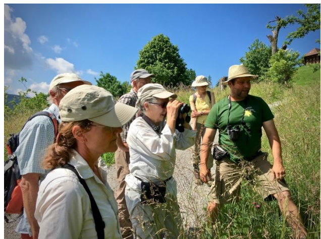
Exkursion Biohof Änggist, Biglen, 2.6.18