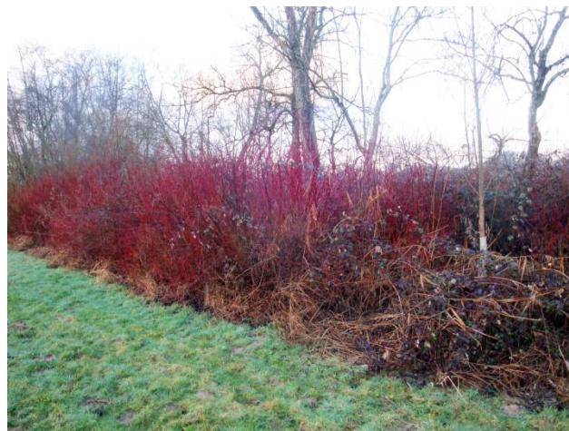
Das Aufeld vor dem Entbuschen