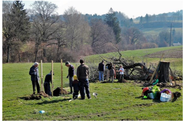
Baumpflanzung Säriswil, 24.3.18