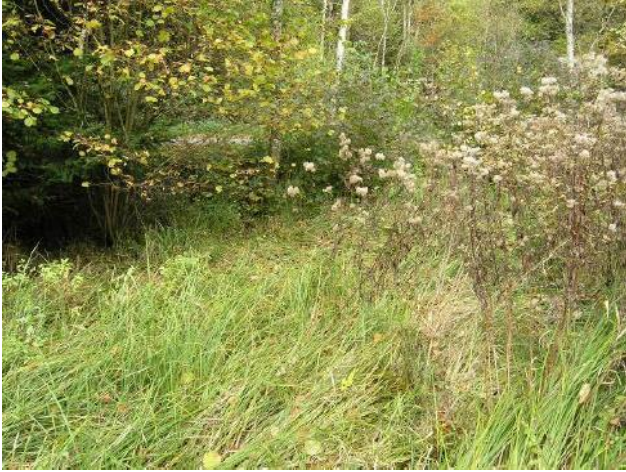
Die bestehenden Tümpel sind verlandet und eingewachsen