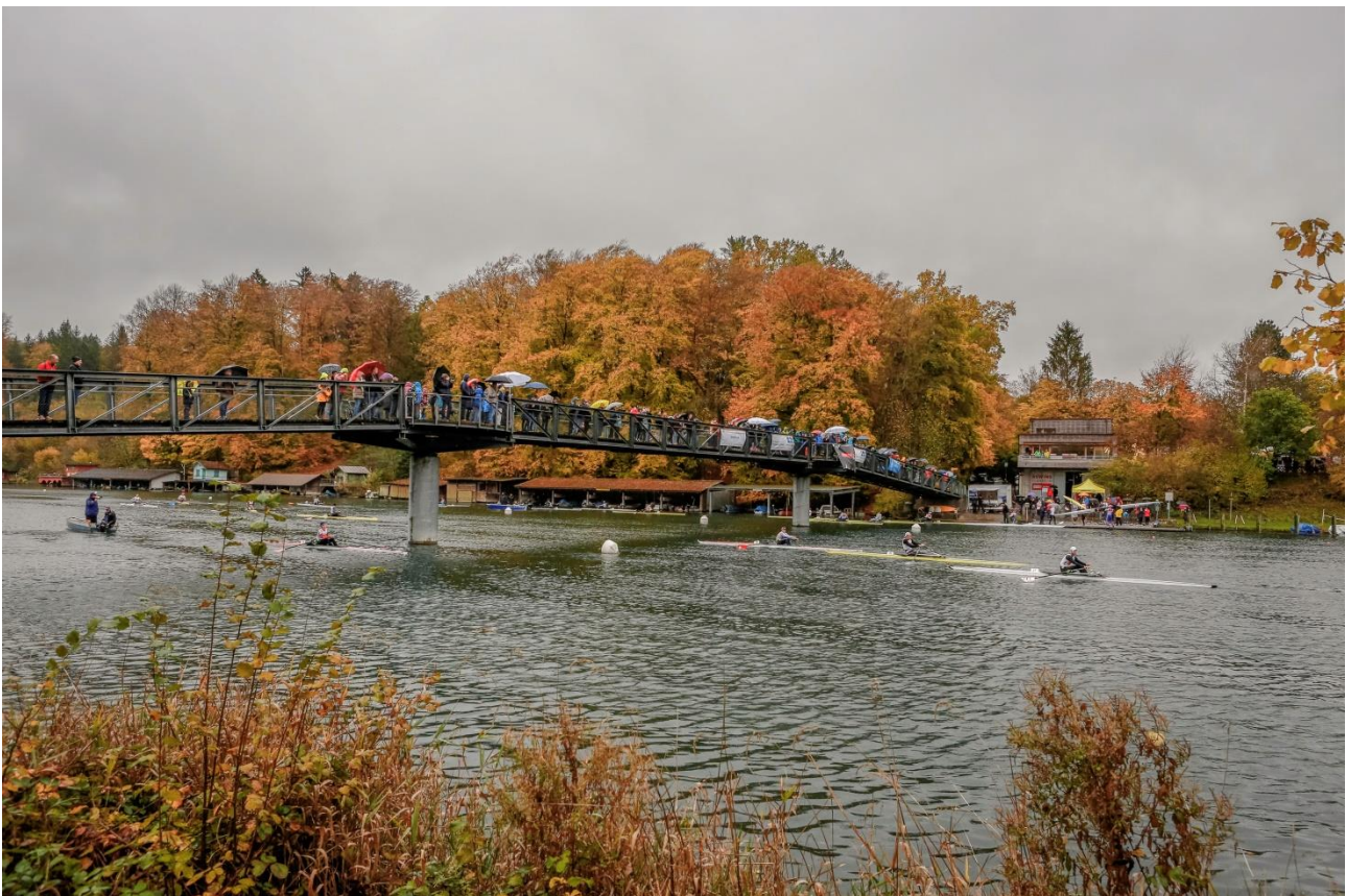
Das Ziel der Strecke beim Stegmattsteg

Beim vorgängig ausgetragenen Sprint gewann bei den Frauen Mirka Knapkova, Olympiasiegerin 2012, Tschechien und bei den Männern der Olympiasieger 2016 und mehrfache Weltmeister Valent Sinkovic, Kroatien.