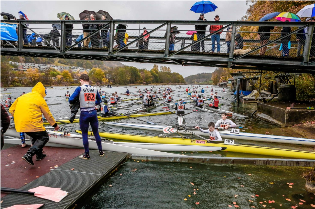
Auswassern nach dem Rennen