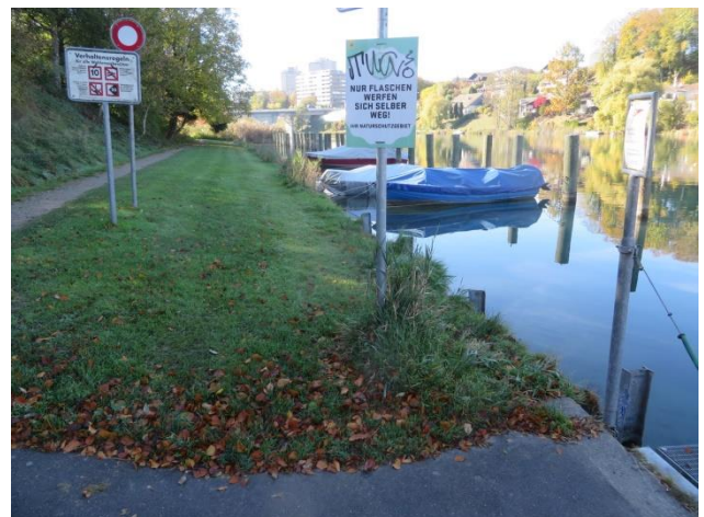
Die Liegewiese westlich des Stegmattstegs ist der Projektperimeter für den Bau des neuen Bootshauses