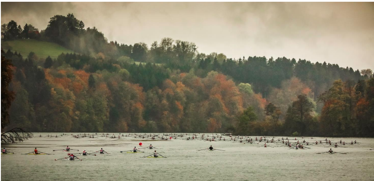
Herbststimmung am letzten Armadacup 2018