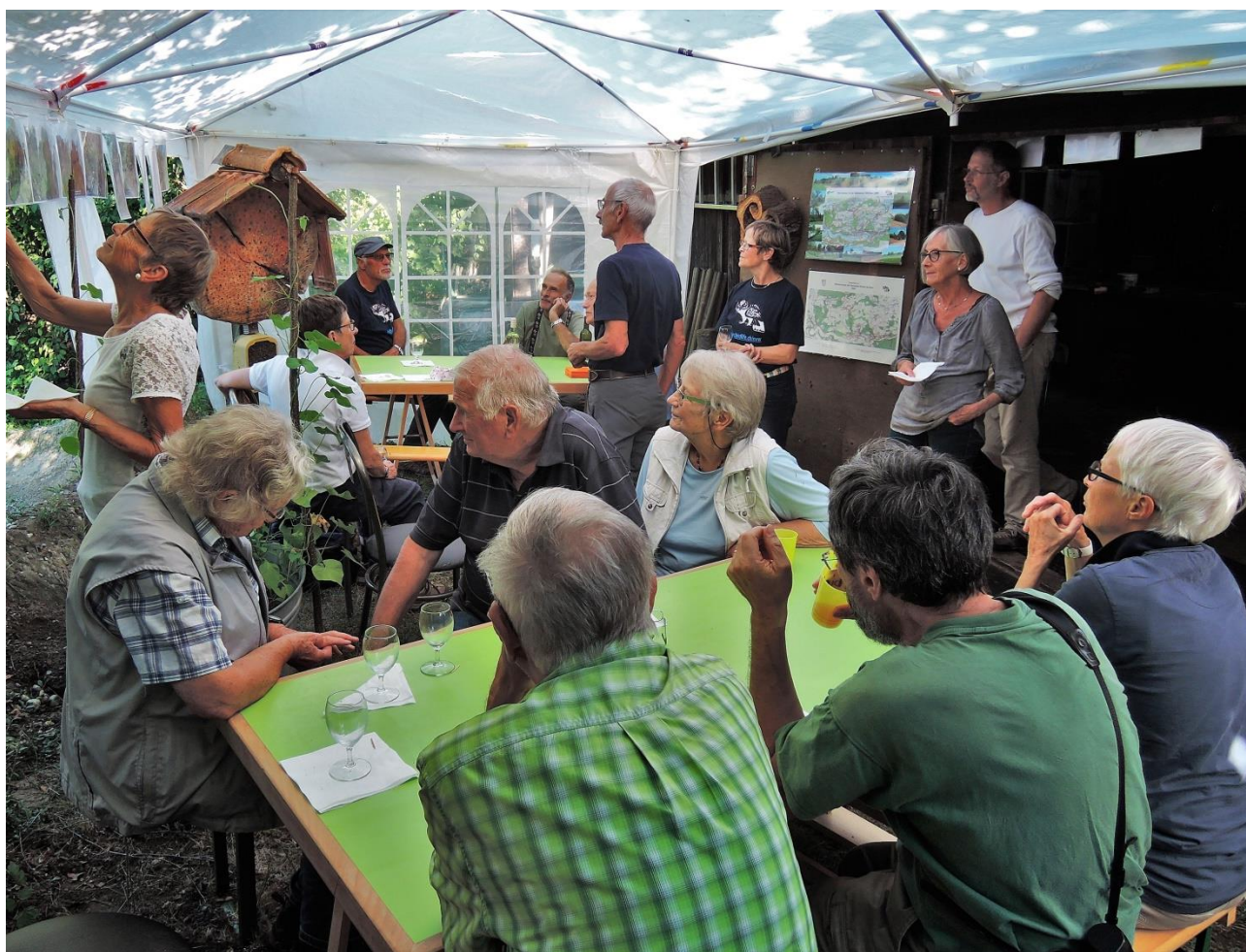
10 Jahre Reservat Chräjenäscht-Wald, 9.9.18

Der NVW wurde 1973 gegründet. Er ist ein gemeinnütziger Verein, der Ende 2018 gut 170 Mitglieder zählte. Er setzt sich für den Natur-, Landschafts- und Vogelschutz ein. Der Schwerpunkt seiner Tätigkeit liegt in der Gemeinde Wohlen BE. Er betreibt Umweltbildung und Öffentlichkeitsarbeit, macht praktischen Naturschutz und redet bei Projekten und Planungen mit, die Natur und Umwelt betreffen. Das war auch 2018, in seinem 45. Tätigkeitsjahr so.