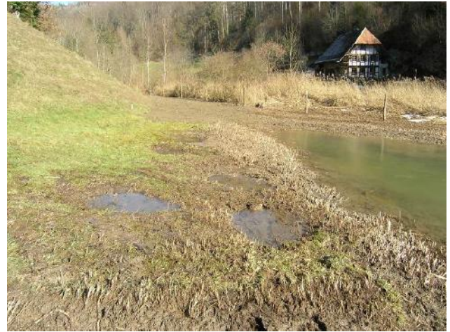
Neben dem Tümpel 1 wurden mehrere Unkenlöcher erstellt

Die ANF ist für die Aufsicht und Pflege im Naturschutzgebiet zuständig. Die im Rahmen des Projekts gemähten und entbuschten Flächen bei den Tümpeln 2 und 3 sollen künftig alle 2-3 Jahre gemäht werden, um ein erneutes Verbuschen der wiederhergestellten Tümpel zu vermeiden und damit die Besonnung der Amphibiengewässer zu gewährleisten.