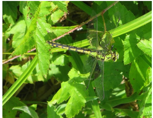
Grüne Flussjungfer

Innerhalb des Projektperimeters auf der Liegewiese neben dem Stegmattsteg hat Frau Koene 2018 folgende Exuvien-Funde (Exuvien sind letzte Larvenhäute von Libellen, die geschlüpft sind. Dies ist der beste Nachweis für ein Vorkommen von Libellen) gemacht: