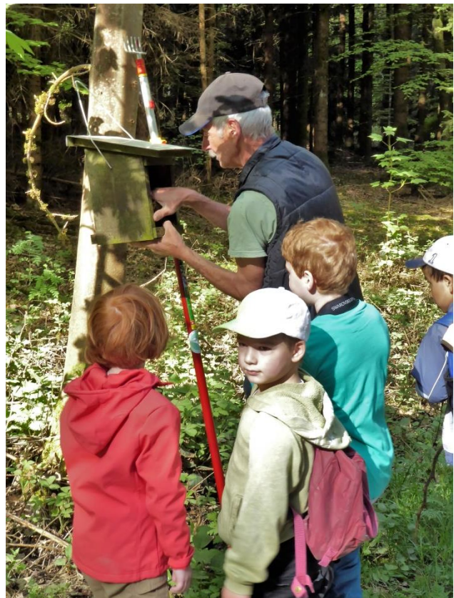
Nistkastenkontrolle im Buechholz, 28.4.18

Hinterkappelen, 30. Januar 2019 Otto Sieber, Präsident NVW