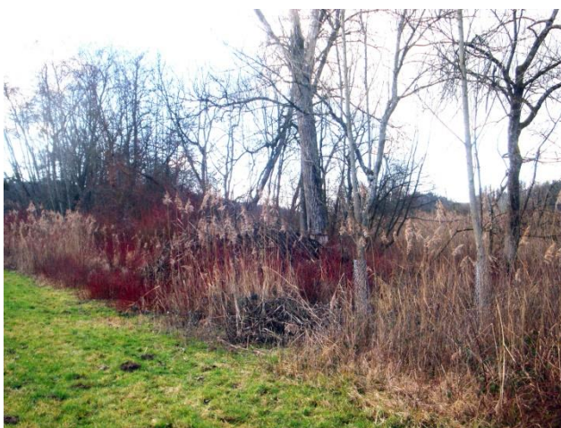
Das Aufeld 12 Monate nachher

Heute steht der PG ein neunsitziges Militärboot mit entsprechender Zulast zur Verfügung. Das Boot gehört dem Schutzverband und diente während der Sanierung der Wohleibrücke auch als Fährschiff.