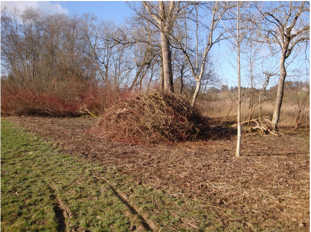
Das Aufeld nach den Entbuschungsarbeiten durch die Pensioniertengruppe